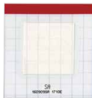
SA(黄色ブドウ球菌用)